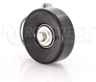
TENSOR DE BANDA ALTERNADOR Y AIRE ACONDICIONADO / POLEA DE REPUESTO RT-131114 • 2003-2004 3.5 V6 GAS

RT-90256 ALT: 31170-P8C-A01 / 31170PGKA02 / 4KAR-256 / 89256