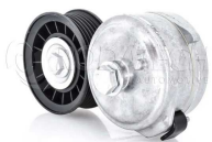
TENSOR DE BANDA POLEA DE REPUESTO RT-113053 • 1996-2005 4.3 V6 GAS