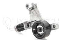
TENSOR DE BANDA POLEA DE REPUESTO RT-138280 • 2009-2010 2.4 L4 GAS