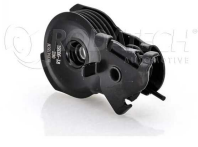
TENSOR DE BANDA TENSOR SECUNDARIO / EN BOMBA DE AGUA • 2004-2005 3.0 V6 GAS