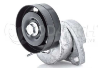
TENSOR DE BANDA VEHÍCULO CON AIRE ACONDICIONADO Y DIRECCIÓN HIDRÁULICA / POLEA DE REPUESTO RT-137027 • 1998-2003 2.2 L4 GAS

RT-90269 ALT: 12573024 / 4KAR-269 / 49280