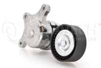
TENSOR DE BANDA POLEA DE REPUESTO RT-131104 • 2009-2013 3.7 V6 GAS

RT-90382 ALT: 3M4Z8W508A / 49453 / 89382