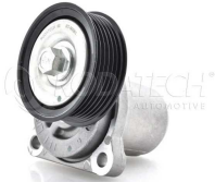
TENSOR DE BANDA • 2006-2008 2.3 L4 GAS

RT-90064 ALT: 3S4Q6A228AB / 3S4Z6A228AA / 4KAR-2021 / 49405