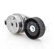
TENSOR DE BANDA • 2012-2018 6.4 V8 GAS • 2006-2018 5.7 V8 GAS