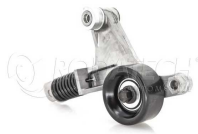
TENSOR DE BANDA POLEA DE REPUESTO RT-138280 • 2008-2008 2.4 L4 GAS