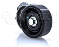
TENSOR DE BANDA POLEA DE REPUESTO RT-131107 • 1996-2005 3.0 V6 GAS