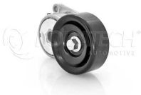
TENSOR DE BANDA PTA • 1998-2002 3.2 V6

RT-90311 ALT: 897125860-0 / 8971258601 / 4KAR-311 / 89311