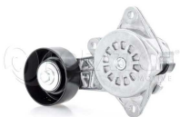
TENSOR DE BANDA POLEA DE REPUESTO RT-131107 • 1996-1999 4.6 V8 GAS