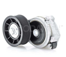
TENSOR DE BANDA TAA • 1993-1993 5.9 V8