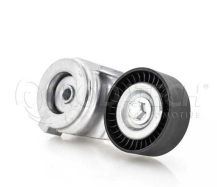
TENSOR DE BANDA TAA • 2009-2011 3.5 V6

RT-90392 ALT: 04891595AA / 4KAR-2026 / 49434