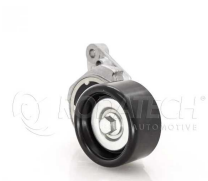
TENSOR DE BANDA POLEA DE REPUESTO RT-131119 • 2008-2011,2013-2020 5.7 V8 GAS

RT-90255 ALT: 16620-0W100 / 166200W036 / 4KAR-255 / 49241