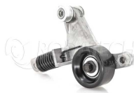
TENSOR DE BANDA POLEA DE REPUESTO RT-138280 • 2006-2008 2.4 L4 GAS