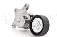
TENSOR DE BANDA POLEA DE REPUESTO RT-131104 • 2007-2010 3.5 V6 GAS

RT-90513 ALT: CY0115980A / 4KAR-2051 / 89603 • 2011-2018 3.7 V6 GAS