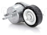
TENSOR DE BANDA TADA • 2001-2006 8.1 V8