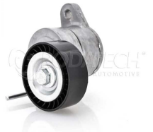
TENSOR DE BANDA POLEA DE REPUESTO RT-138219 • 2007-2009 1.8 L4 GAS • 2010-2012 2.0 L4 GAS

RT-90392 ALT: 04891595AA / 4KAR-2026 / 49434 • 2007-2011 2.4 L4 GAS