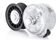
TENSOR DE BANDA POLEA DE REPUESTO RT-113053 • 1996-2000 5.7 V6 / 7.4 V8 GAS

RT-90213 ALT: 6003051 / 4KAR-213 / 49214