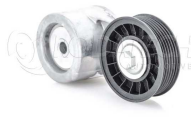
TENSOR DE BANDA POLEA DE REPUESTO RT-131107 • 1992-1993 6.2 V8 DIESEL • 1994-1995 6.5 V8 DIESEL