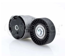
TENSOR DE BANDA POLEA DE REPUESTO RT-131104 • 2011-2019 3.6 V6 FLEX