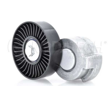
TENSOR DE BANDA TAA • 1990-1993,1996-2000 3.3 V6

RT-90251 ALT: 89251 / KR-90251 • 1994-2000 3.8 V6