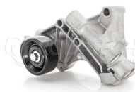
TENSOR DE BANDA TAA • 2000-2005 3.8 V6 GAS