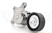
TENSOR DE BANDA POLEA DE REPUESTO RT-131104 • 2009-2016 3.7 V6 GAS

RT-90218 ALT: F8ZE-6B209-BA / 4KAR-218 / 49236