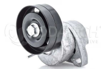
TENSOR DE BANDA VEHÍCULO CON AIRE ACONDICIONADO Y DIRECCIÓN HIDRÁULICA / POLEA DE REPUESTO RT-137027 • 2001-2003 2.2 L4 GAS

RT-90311 ALT: 897125860-0 / 8971258601 / 4KAR-311 / 89311 • 2004-2004 3.5 V6