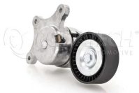
TENSOR DE BANDA POLEA DE REPUESTO RT-131104 • 2008-2015 3.7 V6 GAS