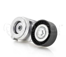
TENSOR DE BANDA TAA • 2008-2010 3.5 V6 GAS

RT-90392 ALT: 04891595AA / 4KAR-2026 / 49434