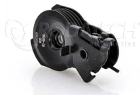
TENSOR DE BANDA TAA / BOMBA DE AGUA • 2001-2005 3.0 V6 GAS