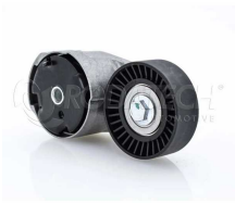
TENSOR DE BANDA POLEA DE REPUESTO RT-131104 • 2011-2014 3.6 V6 FLEX