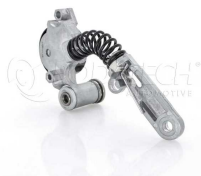
TENSOR DE BANDA APLICABLE EN MODELOS CE, LE Eco • 2014-2021 1.8 L4 GAS