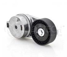
TENSOR DE BANDA POLEA DE REPUESTO RT-131104 • 2005-2008 2.7 V6 GAS • 2006-2008 5.7 V8 / 6.1 V8 GAS

RT-90377 ALT: 4593817AB / 4861660AA / 4KAR-377 / 49345 • 2005-2008 3.5 V6 GAS