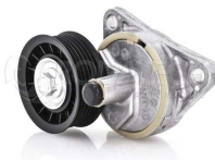
TENSOR DE BANDA TAA • 1999-2002 2.0 L4 GAS

RT-90297 ALT: F53E-6B209-AD / 4KAR-297 / 89297