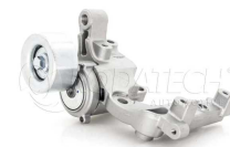
TENSOR DE BANDA POLEA DE REPUESTO RT-138255 • 2005-2015 4.0 V6 GAS