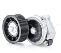
TENSOR DE BANDA TAA • 1992-1993 3.6 V6 / 5.2 V8