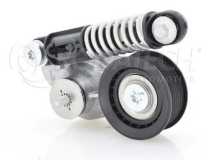
TENSOR DE BANDA • 2012-2015 2.0 L4 GAS

RT-90513 ALT: CY0115980A / 4KAR-2051 / 89603