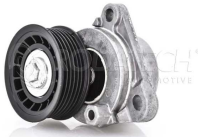
TENSOR DE BANDA POLEA DE REPUESTO RT-113053 • 2005-2008 2.3 L4 GAS

RT-90370 ALT: 4L8E6B209AB / 4KAR-370 / 49344