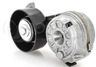
TENSOR DE BANDA POLEA DE REPUESTO RT-131107 • 2001-2004 4.6 V8 GAS