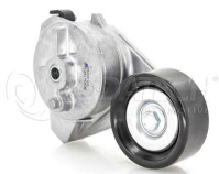
TENSOR DE BANDA TADA • 2004-2005 4.6 V8 GAS