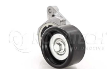
TENSOR DE BANDA POLEA DE REPUESTO RT-131119 • 2010-2019 4.6 V8 GAS