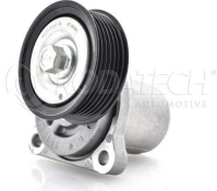
TENSOR DE BANDA • 2007-2012 2.3 L4 / 2.5 L4