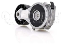
TENSOR DE BANDA POLEA DE REPUESTO RT-131088 • 1998-2003 2.2 L4 GAS