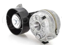
TENSOR DE BANDA POLEA DE REPUESTO RT-131107 • 2000-2011 4.6 V8 GAS