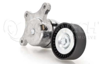
TENSOR DE BANDA POLEA DE REPUESTO RT-131104 • 2007-2012 3.5 V6 GAS