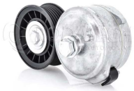
TENSOR DE BANDA POLEA DE REPUESTO RT-113053 • 1996-2014 4.3 V6 GAS