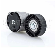
TENSOR DE BANDA POLEA DE REPUESTO RT-131104 • 2011-2021 3.6 V6 GAS