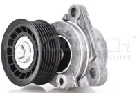
TENSOR DE BANDA POLEA DE REPUESTO RT-113053 • 2007-2008 3.0 V6 / 2.3 L4 GAS

RT-90314 ALT: AJ5715980 / 4KAR-314 / 89314