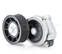
TENSOR DE BANDA TAA • 1992-1993 3.9 V6 / 5.2 V8