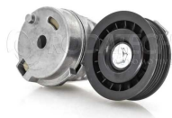
TENSOR DE BANDA TADA • 2006-2006 3.9 V6 GAS