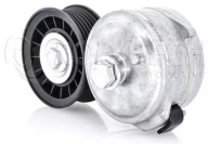
TENSOR DE BANDA POLEA DE REPUESTO RT-113053 • 1996-2014 4.3 V6 GAS