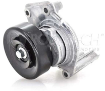
TENSOR DE BANDA TAA • 1998-2007 4.7 V8

RT-90255 ALT: 16620-0W100 / 166200W036 / 4KAR-255 / 49241