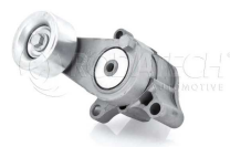
TENSOR DE BANDA POLEA DE REPUESTO RT-138255 • 2007-2020 2.7 L4 GAS