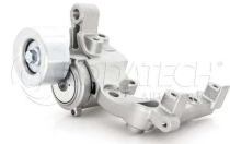
TENSOR DE BANDA POLEA DE REPUESTO RT-138255 • 2003-2010 4.0 V6 GAS

RT-90255 ALT: 16620-0W100 / 166200W036 / 4KAR-255 / 49241