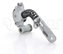
TENSOR DE BANDA • 2018-2021 2.0 L4 GAS

RT-80016 ALT: 166200T010 / 1662037030 / 89688 / 39396