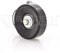
TENSOR DE BANDA TAA • 1999-2001 3.5 V6

RT-90256 ALT: 31170-P8C-A01 / 31170PGKA02 / 4KAR-256 / 89256