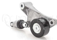
TENSOR DE BANDA TAA • 2001-2003 2.0 L4