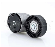
TENSOR DE BANDA POLEA DE REPUESTO RT-131104 • 2020-2021 3.6 V6 GAS