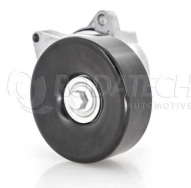
TENSOR DE BANDA TADA • 2004-2004,2008-2012 5.6 V8

RT-80030 ALT: 119553JA0A / 89722 / 39384