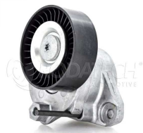
TENSOR DE BANDA TENSOR AUTOMÁTICO DE ACCESORIOS • 2007-2008 3.5 V6