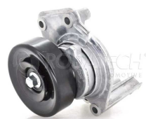
TENSOR DE BANDA POLEA DE REPUESTO RT-131142 • 2000-2009 4.7 V8 GAS