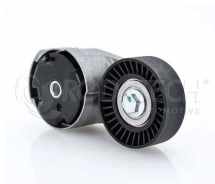
TENSOR DE BANDA POLEA DE REPUESTO RT-131104 • 2011-2016 3.6 V6 GAS