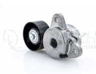
TENSOR DE BANDA • 2013-2020 3.5 V6 GAS

RT-80030 ALT: 119553JA0A / 89722 / 39384