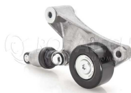
TENSOR DE BANDA TENSOR • 2002-2006 2.4 L4 GAS