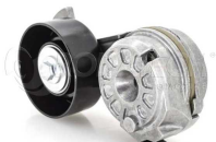
TENSOR DE BANDA POLEA DE REPUESTO RT-131107 • 2000-2004 4.6 V8 GAS