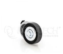
TENSOR DE BANDA TAA • 2003-2005 2.4 L4 GAS

RT-90072 ALT: 4668364AA / 4668364AB / 4KAR-2020 / 89617