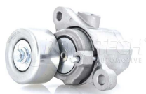
TENSOR DE BANDA • 2016-2021 3.5 V6 GAS