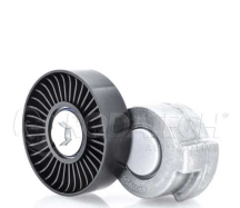
TENSOR DE BANDA TAA • 1990-2000 3.3 V6

RT-90251 ALT: 89251 / KR-90251 • 1996-1999 3.8 V6