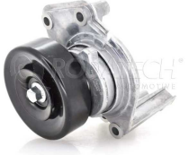
TENSOR DE BANDA TAA • 2003-2009 4.7 V8

RT-90255 ALT: 16620-0W100 / 166200W036 / 4KAR-255 / 49241