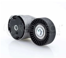
TENSOR DE BANDA POLEA DE REPUESTO RT-131104 • 2011-2021 3.6 V6 GAS