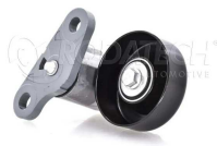
TENSOR DE BANDA TADA • 2003-2007 6.0 V8

RT-90253 ALT: 12554027 / 12580162 / 4KAR-253 / 89253 • 2008-2008 6.2 V8