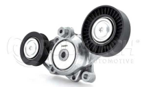
TENSOR DE BANDA DIRECCIÓN HIDRÁULICA / POLEA DE REPUESTO RT-113055 • 2010-2011 2.5 L4 GAS

RT-80018 ALT: 166010V010 / 49437 / 89659