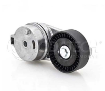
TENSOR DE BANDA • 2008-2010 3.3 V6 FLEX

RT-90377 ALT: 4593817AB / 4861660AA / 4KAR-377 / 49345 • 2008-2010 3.8 V6