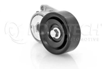
TENSOR DE BANDA TADA • 1998-2004 3.2 V6

RT-90067 ALT: 96298799 / 4KAR-1067 / 49264