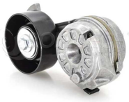
TENSOR DE BANDA POLEA DE REPUESTO RT-131107 • 2003-2004 4.6 V8 GAS