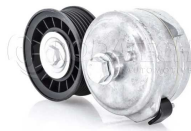
TENSOR DE BANDA POLEA DE REPUESTO RT-113053 • 1996-1999 4.3 V6 / 5.7 V8 / 7.4 V8 GAS