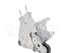
TENSOR DE BANDA POLEA DE REPUESTO RT-113055 • 2000-2005 2.0 L4 GAS

RT-80037 ALT: 68334492AA / 90013 / CTK90013 • 2017-2018 1.4 L4 GAS