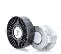
TENSOR DE BANDA TAA • 1991-2000 3.3 V6

RT-90251 ALT: 89251 / KR-90251 • 1997-1999 3.8 V6