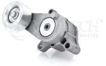
TENSOR DE BANDA POLEA DE REPUESTO RT-138255 • 2010-2010 2.7 L4 GAS