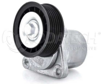
TENSOR DE BANDA TAA • 2003-2007 2.3 L4 GAS

RT-80025 ALT: PE0115980A / PE0115980B / 49858 / 89710