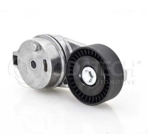
TENSOR DE BANDA POLEA DE REPUESTO RT-131104 • 2009-2021 5.7 V8 GAS • 2008-2010 6.1 V8 GAS • 2015-2019 6.2 V8 GAS