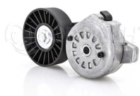
TENSOR DE BANDA TAA • 1997-1999 2.0 L4 GAS