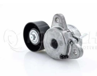
TENSOR DE BANDA • 2013-2017 3.5 V6 GAS

RT-80030 ALT: 119553JA0A / 89722 / 39384