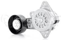
TENSOR DE BANDA POLEA DE REPUESTO RT-131107 • 1994-1997 4.6 V8 GAS

RT-90218 ALT: F8ZE-6B209-BA / 4KAR-218 / 49236