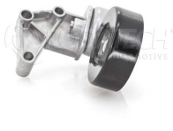
TENSOR DE BANDA POLEA DE REPUESTO RT-131114 • 1994-1997 2.2 L4 GAS