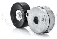
TENSOR DE BANDA POLEA DE REPUESTO RT-131081 • 1995-1999 3.1 V6 GAS