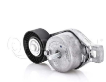
TENSOR DE BANDA TAA • 2001-2007 3.3 V6 / 3.8 V6

RT-90251 ALT: 89251 / KR-90251 • 1994-2000 3.8 V6