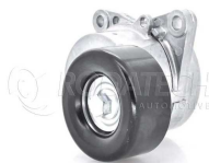
TENSOR DE BANDA • 2012-2017 5.6 V8 GAS

RT-80021 ALT: 119551LA0A / 119551LA0B / 49805 / 39335