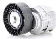
TENSOR DE BANDA TAA • 1998-2001 1.3 L4 GAS