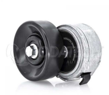
TENSOR DE BANDA TAA • 1991-2000 3.0 V6