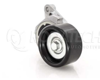
TENSOR DE BANDA POLEA DE REPUESTO RT-131119 • 2008-2020 5.7 V8 GAS