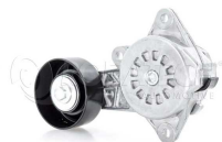
TENSOR DE BANDA POLEA DE REPUESTO RT-131107 • 1993-1998 4.6 V8 GAS

RT-90218 ALT: F8ZE-6B209-BA / 4KAR-218 / 49236