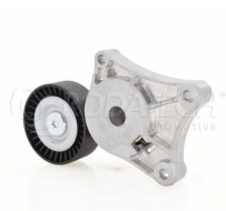
TENSOR DE BANDA • 2015-2018 1.6 L4 GAS

RT-80037 ALT: 68334492AA / 90013 / CTK90013