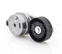
TENSOR DE BANDA • 2011-2014 5.7 V8