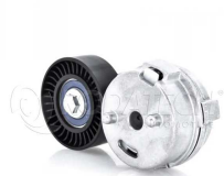
TENSOR DE BANDA TAA • 2003-2006 2.4 L4 GAS