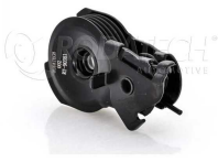
TENSOR DE BANDA TAA / BOMBA DE AGUA • 1999-2002 2.5 V6 GAS

RT-90318 ALT: 97BB6A228AG / BT106 / 4KAR-318 / 49292