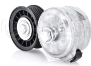
TENSOR DE BANDA POLEA DE REPUESTO RT-113053 • 1996-2000 5.7 V6 / 7.4 V8 GAS

RT-90213 ALT: 6003051 / 4KAR-213 / 49214