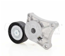
TENSOR DE BANDA • 2017-2020 1.6 L4 GAS

RT-80037 ALT: 68334492AA / 90013 / CTK90013 • 2017-2018 1.4 L4 GAS