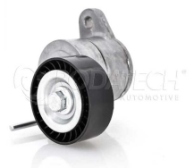
TENSOR DE BANDA POLEA DE REPUESTO RT-138219 • 2009-2020 2.4 L4 GAS

RT-90392 ALT: 04891595AA / 4KAR-2026 / 49434