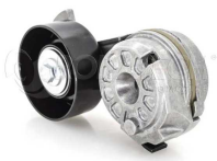
TENSOR DE BANDA POLEA DE REPUESTO RT-131107 • 2000-2010 4.6 V8 GAS

RT-90218 ALT: F8ZE-6B209-BA / 4KAR-218 / 49236