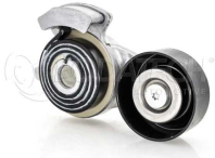
TENSOR DE BANDA TAA • 1995-2000 2.5 V6 GAS

RT-90281 ALT: 1F1E-6B209-AA / 4KAR-281 / 89281