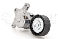
TENSOR DE BANDA POLEA DE REPUESTO RT-131104 • 2008-2009 3.5 V6 GAS