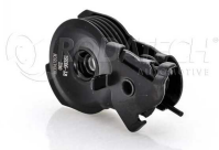
TENSOR DE BANDA TAA / BOMBA DE AGUA • 2000-2001 2.5 V6