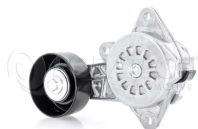
TENSOR DE BANDA POLEA DE REPUESTO RT-131107 • 1992-1999 4.6 V8 GAS