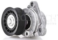
TENSOR DE BANDA POLEA DE REPUESTO RT-113053 • 2006-2009 2.3 L4 GAS

RT-90370 ALT: 4L8E6B209AB / 4KAR-370 / 49344