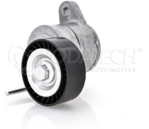
TENSOR DE BANDA POLEA DE REPUESTO RT-138219 • 2008-2014 2.4 L4 GAS

RT-90392 ALT: 04891595AA / 4KAR-2026 / 49434