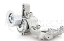
TENSOR DE BANDA POLEA DE REPUESTO RT-138255 • 2005-2011 4.0 V6 GAS