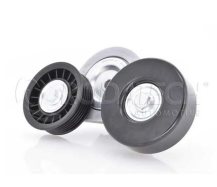
TENSOR DE BANDA TAA • 2004-2007 3.7 V6