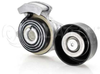
TENSOR DE BANDA POLEA DE REPUESTO RT-131107 • 2001-2007 2.5 V6 GAS