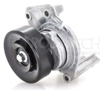
TENSOR DE BANDA TAA • 2001-2009 4.7 V8