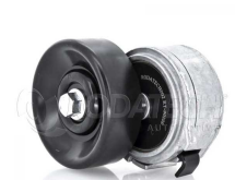
TENSOR DE BANDA TAA • 1991-2000 3.0 V6