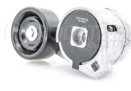
TENSOR DE BANDA POLEA DE REPUESTO RT-131107 • 1994-1999 6.5 V8 DIESEL