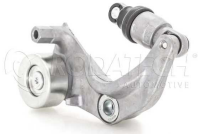
TENSOR DE BANDA POLEA DE REPUESTO RT-113044 • 2016-2022 1.8 L4 GAS

RT-90397 ALT: 31170RNAA01 / 31170RNAA02 / 4KAR-2034 / 89600