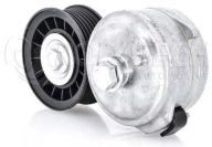
TENSOR DE BANDA POLEA DE REPUESTO RT-113053 • 1996-2001 4.3 V6 GAS

RT-90231 ALT: 10239670 / 12456152 / 4KAR-231 / 49203