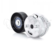
TENSOR DE BANDA TAA • 2001-2003 2.4 L4