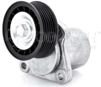
TENSOR DE BANDA POLEA DE REPUESTO RT-113053 • 2001-2007 2.0 L4 GAS