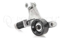
TENSOR DE BANDA POLEA DE REPUESTO RT-138280 • 2009-2014 2.4 L4 GAS

RT-90356 ALT: 16620-0D020 / 4KAR-2002 / 89356