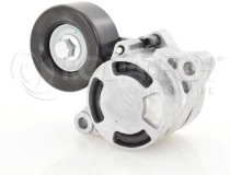
TENSOR DE BANDA • 2015-2019 1.5 L4 GAS