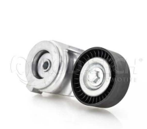
TENSOR DE BANDA TAA • 2008-2010 4.0 V6

RT-90377 ALT: 4593817AB / 4861660AA / 4KAR-377 / 49345 • 2008-2010 3.8 V6