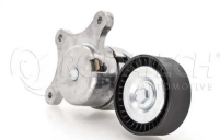
TENSOR DE BANDA POLEA DE REPUESTO RT-131104 • 2010-2019 3.5 V6 / 3.7 V6 GAS

RT-80014 ALT: DS7Z-6A228-A / 49827 / 89740