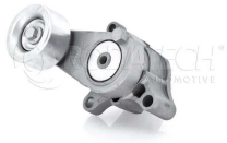
TENSOR DE BANDA POLEA DE REPUESTO RT-138255 • 2006-2015 2.7 L4 GAS