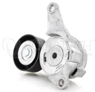
TENSOR DE BANDA TADA • 2010-2013 3.6 V6